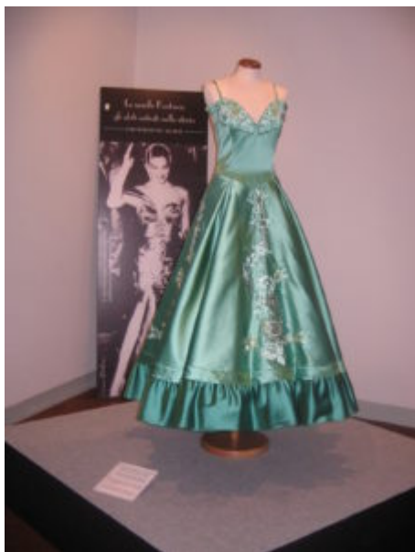
Abito Sorelle Fontana per Ava Gardner

“Si rifiutavano a mostrarsi non eleganti. Non andrebbero in giro come si va oggi. Credo che Audrey come Ava Gardner non potrebbero lasciarsi sedurre dalla moda volgare. Erano contrarie al cattivo gusto. Eleganza è il contrario di complicato. Oggi le donne accettano lo stile volgare, lo subiscono, ma senza entusiasmo“.