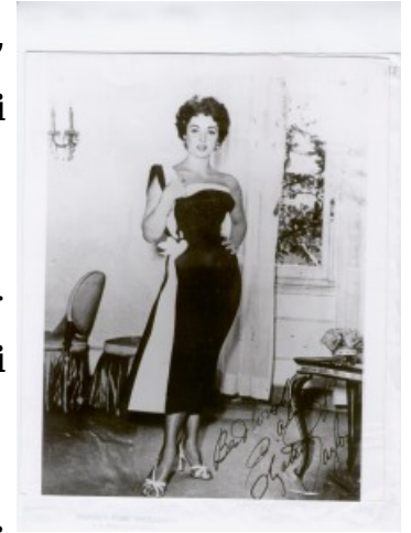
Liz Taylor abito Sorelle Fontana