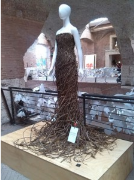
'eleganza del cibo

La seconda mostra capitolina, “L'ELEGANZA DEL CIBO” TALES ABOUT FOOD AND FASHION , in corso dal 19 maggio al 1 novembre 2015, ha sede presso i Mercati di Traiano in Via Quattro Novembre, 94. Curata da Stefano Dominella e della storica Bonizza Giordani Aragno , fa parte degli eventi presenti a Roma in occasione dell' EXPO 2015 , la mostra, un tributo all'inscindibile legame tra cibo e moda, vuole rappresentare come questi elementi si contaminino vicendevolmente. Cibo e abito servono corpo e anima, offrendo loro:” protezione, nutrimento e conforto”.