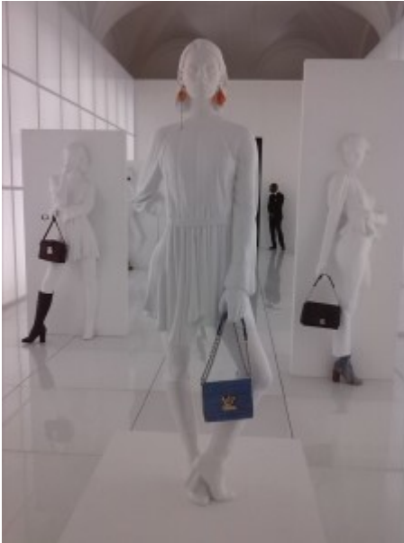
Louis Vuitton - "Exhibition Series 2"

Finalmente il bel tempo è giunto anche nella capitale e a festeggiare questo ardimentoso patto col meteo, aprono la stagione un paio di esposizioni sulle eccellenze internazionali della moda. La prima mostra, è stata proposta dalla Maison Francese LOUIS VUITTON ; "EXIBITION SERIES 2" dal 22 maggio al 7 giugno 2015; presso la sede di PALAZZO RUSPOLI, Via del Corso, 418, Roma.