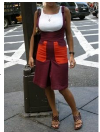
Abito non adeguata al fisico

Il segreto della vera eleganza appartiene sicuramente a chi è in grado e possiede la capacità di abbinare i capi " intonandoli " alla propria persona, al proprio fisico, alla propria identità in modo armonioso. Ma, vista la disinvoltura quasi grottesca con cui, invece, ognuno porta di tutto, con la scusa che "va tutto", occorre soffermarsi un attimo seriamente.