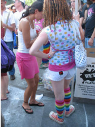
Solo per le giovanissime, solo ad una festa a tema "pagliacci"

Corsi di dress code per studenti? Sì ma anche per genitori troppo giovanilistici..... L'uovo viene dal becco.