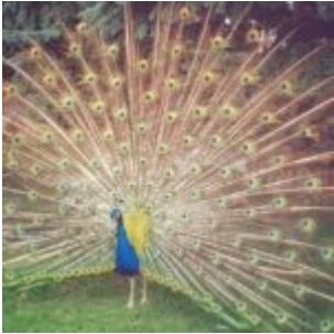
Il bel piumaggio del pavone

Quante volte ci siamo poste davanti all'armadio traboccante di abiti, gonne, pantaloni e via dicendo, chiedendoci ciò? Il dubbio scatta soprattutto quando occorre abbigliarsi per un'occasione particolare.