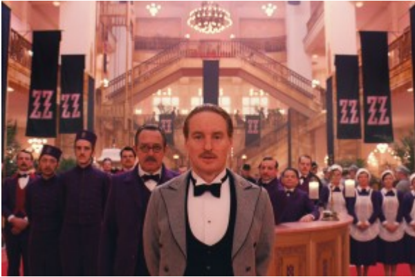
L'ingresso del Grand Budapest Hotel

Mentre questi due film presentavano un'ambientazione contemporanea, per quanto conforme alla stravaganza del regista americano, “Grand Budapest Hotel” è ambientato in un periodo che potrebbe essere quello a cavallo tra le due guerre mondiali, in un immaginario paese dell'Europa dell'Est di nome Zubrowka, nell'albergo che dà il nome al lungometraggio. Protagonisti sono il concierge, l'eccentrico e raffinato Monsieur Gustave H. (Ralph Fiennes), ed il giovane facchino che prende in simpatia, Zero Moustafa (Tony Revolori), che vivono una rocambolesca e bizzarra avventura in cui non mancano omicidi, inseguimenti ed il furto di una nota opera d'arte.