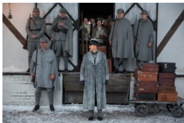
L’ispettore Henckels con la sua pattuglia