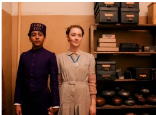
Zero e Agatha

Il logo dei militari, due z affiancate simili a saette di colore rosa scuro su sfondo nero, di vaga suggestione nazista, è opera di Anderson, con cui la Canonero ha lavorato fianco a fianco: nonostante la sua visione fosse estremamente creativa e precisa e la costumista si fosse lasciata immergere nel suo mondo, lui l’ha incoraggiata ad apportare il suo contributo creativo. A lui è spettata comunque l’ultima parola, soprattutto per quanto riguarda trucco e capelli, a cui ha dato il suo tocco eccentrico.