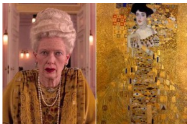
Madame D a confronto con il “Ritratto di Adele Bloch-Bauer I” (1907) di Gustav Klimt

La costumista ha collaborato anche con Prada, che ha prodotto la giacca di pelle nera - tutti gli antagonisti del film sono vestiti unicamente di questo colore- che ha disegnato per Jopling (Willem Dafoe), il sicario che insegue i due protagonisti, aggiungendovi su richiesta del regista una tasca per il suo arsenale di armi. In una scena lo si vede fare uso di nocche d’argento, create appositamente per il film da un caro amico di Wes Anderson, Waris Ahluwalia, rinomato gioielliere ma anche attore, essendo apparso in diverse pellicole del regista - in “Grand Budapest Hotel” interpreta il concierge indiano.