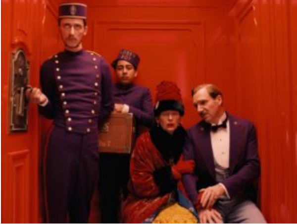
Zero, Madame D e Monsieur Gustave

Sembra quasi che ci si sia stancati delle imponenti ricostruzioni storiche più o meno accurate, sfarzose e dal gusto scenografico. Negli ultimi anni l' Oscar per i costumi è stato conferito ad “Anna Karenina” (2012) di Joe Wright ed ad “Il grande Gatsby” (2013) di Baz Luhrmann, che hanno proposto un nuovo genere di sperimentazione: contaminare l'abbigliamento d'epoca con tendenze contemporanee, nel primo caso la Russia di fine Ottocento con l'alta moda parigina degli anni Cinquanta e nel secondo gli Stati Uniti degli anni Venti con le creazioni degli ultimi anni di Miuccia Prada. Non bisogna poi dimenticarsi dei fantasy, oramai parte sempre maggiore delle uscite cinematografiche annuali, sotto il predominio assoluto della Disney , dall' Oscar per “Alice in Wonderland” (2010) di Tim Burton fino alla presenza di ben due film su cinque tra le nomination di quest'anno, “Into the Woods” di Rob Marshall e “Maleficent” di Robert Stromberg, ed appare lecito supporre che l'anno prossimo uno dei favoriti sarà “Cenerentola” di Kenneth Branagh.