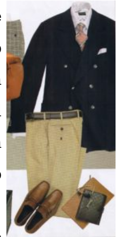
Blazer doppiopetto blu con pantalone coloniale

Ma vediamo quali sono i migliori abbinamenti per un capo così diffuso e apparentemente semplice da indossare. Innanzitutto, l'abbinamento considerato universalmente ideale per il blazer è il pantalone di flanella grigio chiaro, scelta che negli anni si è però trovata ad essere superata dal pantalone grigio scuro che, nonostante l'apparente eleganza formale, non esalta il blu e conferisce all'intero look un aspetto abbastanza tetro. Altro classico è l'accostamento al pantalone Cavalry Twill nelle varie tonalità del marrone e del beige, l'uniforme inglese per eccellenza per il noto venditore di abbigliamento maschile Cordings di Piccadilly. Altra scelta vincente risiede nel pantalone coloniale in cotone, con o senza pince, con o senza risvolto. L'unione dei due capi costituisce uno sfondo neutro per camicia e cravatta e dona alla figura un'eleganza classica senza tempo. Abbinamento da evitare rigorosamente è quello con il pantalone in velluto, eccezion fatta per determinate tonalità come il bordeaux e il beige, a patto che il tessuto pesante del blazer si addica alla foggia del sotto. Infine, ultimo accostamento da tenere in considerazione è quello con il jeans, amato dai giovani ma decisamente passato di moda, in quanto compromesso forzato fra eleganza e informalità.