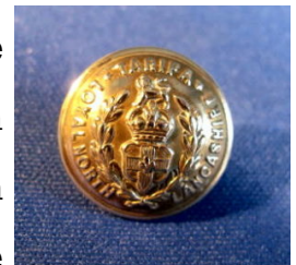
Bottone con stemma

Il vero primo blazer, o piuttosto dovremmo dire Navy Blazer, dato che è questo il suo vero nome di battesimo, fu creato per l'equipaggio della fregata inglese HMS BLAZER, in occasione nel 1837 della visita della regina Vittoria. Quest'ultima apprezzò particolarmente la foggia di tale capo d'abbigliamento e da quel momento la giacca in esame venne adottata dagli equipaggi di svariate navi. Da lì in poi la diffusione fu talmente capillare che il suo utilizzo divenne trasversale a più strati della società.