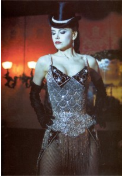
Satine - Nicole Kidman in Moulin Rouge!

“Diamonds are a girl’s best friend” : i diamanti sono i migliori amici delle ragazze. Lo cantava Marilyn Monroe ne “Gli uomini preferiscono le bionde”, film del 1953 di Howard Hawks; lo canta Nicole Kidman , in una versione rivisitata con qualche frase tratta da “Material Girl” di Madonna, in “Moulin Rouge!” di Baz Luhrmann , uscito nel 2001. Nel film la Kidman interpreta Satine, la stella del “Moulin Rouge”, il night-club della Parigi del 1899, dove ricchi e poveri si lasciano trascinare in una barabanda di piaceri proibiti con le ballerine del locale. Soprannominata il “diamante splendente”, Satine non è nient’altro che una cortigiana; di lei si innamora ricambiato, Christian ( Ewan McGregor ) uno scrittore squattrinato giunto a Parigi per aderire alla rivoluzione bohémien.