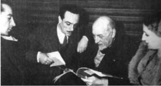
Edoardo De Filippo e Luigi Pirandello

L’ho scoperta quasi per caso e mi è piaciuta subito moltissimo questa poesia di Eduardo De Filippo intitolata “ Il vestito alla moda ”, tanto che adesso voglio condividerla con voi.