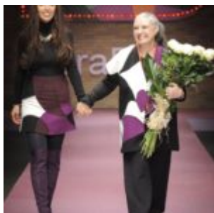
Laura Biagiotti e la figlia Lavinia

E' nota la passione di Laura Biagiotti per il Futurismo, tanto da presentarsi in passerella assieme alla figlia Lavinia con un abito "futurista" della sua collezione. Sappiamo che è collezionista delle opere di Giacomo Balla.