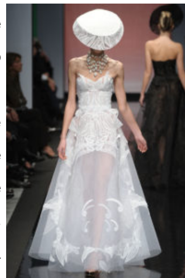
Gattinoni P/E 2013

La collezione punta su souplesse e trasparenze. Bianco, nero e avorio offrono un interessante contrappunto cromatico dialogando con colori più caldi come il giallo cadmio, l'arancio e il corallo. Proprio il giallo, il bianco e l'arancio definiscono abiti lunghi dalle spalline scivolanti caratterizzati da corpetti e baschine, che sembrano rielaborare, con gusto assolutamente contemporaneo, le suggestioni del costume tardo-ottocentesco e della Belle Époque . Le creazioni si abbinano a cappelli che rievocano il fascino della veletta, caratterizzati da forme avveniristiche. Il nero è maestro di stile negli abiti bustier che giocano con differenti lunghezze, nell'alternanza a righe con il colore bianco, nelle "ragnatele"