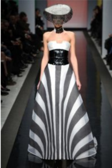
Gattinoni P/E 2013

La moda ridisegna volumi, misure e proporzioni. A partire da un modello virtuale si determinano infinite possibilità di scelta, indizi che ridefiniscono il concetto di “fisicità” nell’abito, le regole che, a partire dal corpo, possono essere imposte alla materia fluida del tessuto. La maison Gattinoni ed il suo Direttore Creativo Guillermo Mariotto hanno presentato, presso il Salone d’Onore del Museo Nazionale delle Arti e Tradizioni Popolari dell’Eur, una collezione haute couture pensata per la primavera/estate 2013, che aspira alla multidimensionalità, che indaga visioni e riproduzioni prospettiche, assieme alla possibilità di lavorare i tessuti secondo le regole della computer grafica. Le creazioni di Gattinoni hanno sfilato fra gli abiti esposti nell’ambito della mostra “La Seduzione dell’Artigianato ovvero: il bello e il ben fatto”, curata dal Presidente della maison Stefano Dominella e visitabile fino al 10 febbraio, offrendo una nuova interpretazione del concetto di artigianato sartoriale. Il parterre, come sempre ricco di personaggi di rilievo e volti noti del mondo dello spettacolo, è stato dotato di occhiali 3D. Eppure l’universo 3D è solo il mondo di partenza, per costruire la fascinazione di una quarta dimensione che aggiunga illusione all’illusione, attraverso materiali e pannelli di stoffa che sembrano avere perso per magia il loro peso.