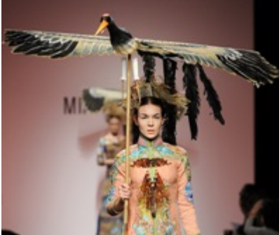
Minh Hanh

Gli accessori sono realizzati in osso, come i monili per i capelli, grandi pettini, fissati su acconciature orientate verso l'alto, ispirati ai gioielli indossati dalle antiche imperatrici vietnamite.