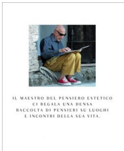
Gillo Dorfles - il retro dell'ultimo libro

La sua meta, forse, ha assunto il volto di qualcosa da interiorizzare per poi dividerne generosamente la meraviglia.