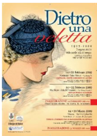
Locandina di una mostra

Dietro la veletta ogni sguardo aveva non uno, ma infiniti significati. Strumento raffinato di seduzione, quella lieve cortina di pizzo era in grado di rendere squisitamente audace qualunque donna la indossasse.