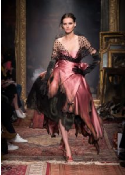
Moschino A/I 2016-17