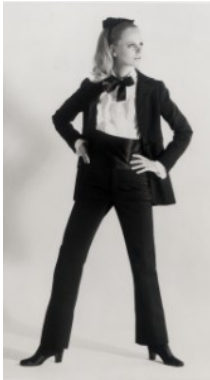
Le Smoking YSL a/i 1966/1967

Ha da poco compiuto ben 123 anni, ma, in realtà, più il tempo passa, più il cosiddetto black tie sembra ringiovanire, forte di nuove versioni, sia per lui che per lei, e di seguaci celebri, tra cui l'indimenticabile e letale 007 James Bond! Lo smoking si dice sia stato indossato per la prima volta il 10 ottobre 1886 dall'industriale del tabacco Griswold Lorillard al Tuxedo Club nel New Jersey e da quel giorno, nel cui ricordo è stato festeggiato il centenario, questo capo viene chiamato negli USA "tuxedo", in omaggio al suo luogo d'origine.