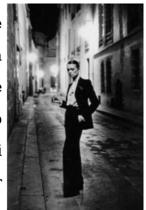
Helmut Newton in Smoking YSL

È, inoltre, importante sapere che quando un uomo riceve un invito che riporta la dicitura black tie/cravate noir o abito da sera, egli deve presentarsi con uno smoking, che deve essere portato sempre e solo in