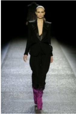
Smoking Nina Ricci a/i 2010

Dopo aver affrontato una precisa e doverosa descrizione dello smoking, è arrivato il momento di concentrarsi sulle varianti presentate dagli stilisti che si possono incontrare nella storia del costume. Nel 1966, Yves Saint Laurent propose, per la prima volta, sulle passerelle femminili quest'abito fino ad allora esclusivamente maschile: un bellissimo smoking da donna, caratterizzato da una giacca sartoriale dai revers lucidi. Quest'indumento è, da allora, stato sempre incluso nelle sue collezioni, ad esempio nel 1970 è stata presentata una versione ad abito, l'anno successivo con gli shorts, nel 1975 una molto simile a una tuta, nell'81 una tipo caban, dieci anni dopo con il trench e cinque anni più tardi con la sahariana. Successivamente, Stefano Pilati ha presentato per la stessa griffe una collezione androgina, rielaborando l'eredità lasciata dal talentuoso maestro.