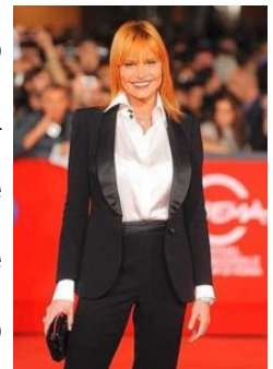
Simona Ventura in smoking Giorgio Armani

Questo indumento è, infatti, diventato un capo indispensabile anche per le donne che vogliono vestirsi con gusto e molte dive, come Simona Ventura, Mary Kate Olsen o Selma Blair, fanno concorrenza ai loro colleghi più illustri ed eleganti preferendolo ad abiti da sera per sfilare sul red carpet.