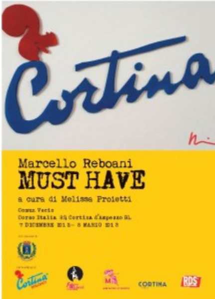
"I Must Have" Marcello Reboani a Cortina

Per terminare la nostra piccola carrellata di suggerimenti occorre sollevare lo sguardo verso le vette innevate e munirsi di catene e di capi caldi e pesanti.... Cortina, perla e regina delle Dolomiti, la meta prefissata. È qui, nelle sale del Comun Vecio , che fino all'8 di marzo è in atto la mostra "MUST HAVE", dell'artista romano Marcello Reboani, dedito a recuperare materiali disparati che, una volta rielaborati, si trasformano in opera artistica. Prodotti di uso comune o straordinario che, a prescindere dal loro significato nell'immaginario collettivo, appaiono nuovi e rivisitati. Inaugurata anch'essa il 7 dicembre nell'ambito della seconda edizione del "Cortina long fashion weekend", gli oggetti-cult contemporanei o meno vivono in modo iconografico una vita diversa.