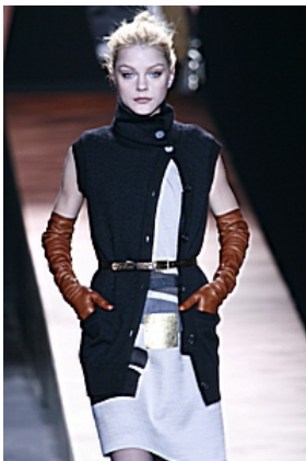
Etro A/I 07-08

corti o lunghi in proporzione alla lunghezza delle maniche dell'abito. Nell'800, con il ritorno a un abbigliamento elitario tornano di gran moda: una signora elegante non esce mai senza. Guanti anche fra le pareti domestiche: è il tempo dei mezzi guanti, o mitene, quasi sempre in rete. Per l'uomo sono gialli in pelle per il giorno, bianchi per la sera. Alla fine dell'Ottocento, i guanti non sono più così indispensabili al corredo dell'eleganza e diventano segno di distinzione, di distacco, come a difendere la mano dal contatto con altre persone. Dai primi anni del Novecento rispuntano i guanti lunghissimi, increspatis sull'avambraccio, e seguono i gusti correnti cambiando continuamente sembianze: con inserti di colore, con rovesci alla moschettiera, in cocodrillo, in cinghiale, in paglia. Per l'estate, in seta o in rete.