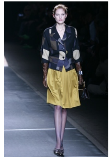
Etro A/I 07-08

Accessori millenari, i guanti hanno saputo affrontare la storia. A volte desiderati altre volte ripudiati, i guanti erano già in uso presso gli Egizi e presto arrivarono anche in Grecia e a Roma, dove avevano più che altro una funzione simbolica durante le cerimonie. Nel Medioevo il guanto è parte del rito d'investitura feudale, segno di fiducia nella donna a cui veniva donato, segnale di sfida o di disprezzo se gettato o sbattuto. I primi guanti femminili compaiono solo nel IX secolo, sono in seta o in lana, chiusi al polso con tre bottoncini o con ampio risvolto spesso foderati di pelliccia. In pelle venivano indossati per l'equitazione, molto più preziosi e pregiati quelli di re e regine, ricamati con lamine d'oro e profumati da essenze. Dal 1300 i guanti sono di uso comune in Italia e durante il Rinascimento si impreziosiscono con gemme preziose. Quelli femminili, quasi interamente in fil d'oro, sono ormai così costosi che se ne occupano le leggi suntuarie: vietato possederne più di 32 paia. Il '600 vede una grande varietà: di raso, velluto, panno, arricchiti di merletti, frange e ricami. Sono