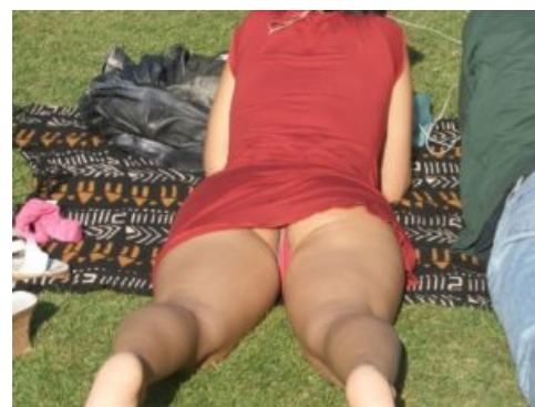
Panorama al parco

L’odierna sfrontatezza o spudoratezza (nel suo I vizi capitali e i nuovi vizi il filosofo U. Galimberti considera quest’ultima uno dei sette nuovi vizi) nell’esibire senza “prudèrie” disfacimenti, mancanza di armonia e di proporzioni, omologazione nell’appiattimento, non può certamente aiutarci a definire l’amore per la bellezza come un valore. Poiché la bellezza si salvaguarda e si mantiene quando, nel vederla, impariamo ad amarla e a sentirci privilegiati nel vivere in mezzo ad essa, combattere tutto ciò che la vorrebbe distruggere credo sia un dovere assoluto. Forse dunque il brutto e, in questo caso, la rappresentazione del brutto tramite scatti fotografici, potrebbe diventare veicolo di “educazione al bello”, in modo quasi paradossale. Una sorta di presa di coscienza, di scuotimento, di elettrochoc che diradi, svegli e incoraggi. Che tolga ipocrisie mascherate da false necessità.