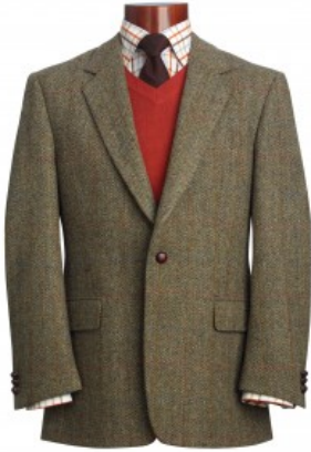
Modello Taransay Harris Tweed

Ma la storia della giacca sportiva è legata più che mai al suo tessuto: il tweed . La parola deriva da un fiume della Scozia che ha dato il proprio nome ai tessuti prodotti nei territori su cui scorre. Nei grandi centri tessili, che sorgevano nell'800 lungo questo fiume, gli abitanti iniziano a filare e tessere questo celebre tessuto che in futuro diventerà l'emblema del loro paese. Famoso in tutto il mondo per la sua consistenza solida, che ne garantisce la durata per anni, il tweed è caratterizzato da una lana cardata, un po' selvaggia, dal classico motivo spigato e da tinture realizzate con processi primitivi e ingredienti naturali. Per i cultori della tradizione inglese il tweed diventa una leggenda. Successivamente viene realizzato in molti colori e motivi. Tra tutti spicca l' Harris : il tweed per antonomasia.