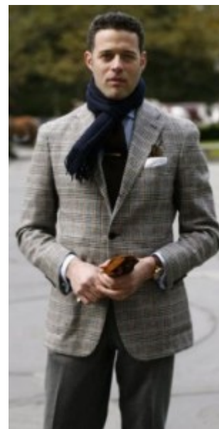
Giacca in tweed

La tradizionale giacca di tweed inglese è allacciata con tre bottoni di osso. I bottoni in cuoio si trovano per lo più nelle versioni continentali che vogliono avere un particolare tocco British. Le tasche oblique e lo spacco centrale sono la reminescenza della giacca da cavallerizzo. La versione americana ha invece solo due bottoni e alternativamente uno spacco centrale o due laterali. Le tasche sono dritte e il tessuto è più morbido rispetto a quello del modello inglese.