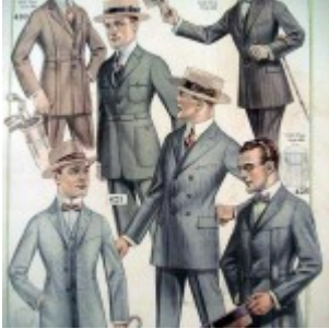
Figurini giacche uomo

Paragonabile per eleganza ad un abito, raffinata e dalla linea impeccabile: la giacca sportiva ha conquistato una posizione di prestigio tra i capi preferiti dagli uomini. Prima adatta esclusivamente per la caccia, poi addirittura alternativa all'abito. Questa giacca ha scalato le convenzioni suntuarie fino ad arrivare ai modelli che oggi ammiriamo. Inscindibile dal suo classico tessuto scozzese, la giacca e il tweed hanno segnato l'evoluzione della moda.