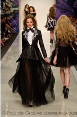
Roccobarocco P/E 2012

La notizia era di dieci giorni fa. Qualcuno aveva rubato l'intera collezione p/e 2011 di RoccoBarocco pronta per essere presentata alla Fashion Week di Milano. La domanda è spontanea. E' stata ritrovata? Era già pronta una di riserva? Oppure lo stilista ha compiuto il miracolo di ripensare e far confezionare in soli 10 giorni una collezione che non fa rimpiangere quella smarrita? La collezione è bella, romantica, a tratti si indovina l'ispirazione orientale dichiarata dallo stilista e ne viene fuori una donna molto seducente; a tratti la reinterpretazione del newlook presenta una donna moderna, ma più rassicurante. Il look delle modelle, capelli cotonati e occhi molto truccati ci riportano agli anni '70: rigorosamente bionde richiamano immagini di Brigit Bardot, ma l'acconciaura dei capelli ricorda anche Amy Winehouse la cui voce risuona nella sala.