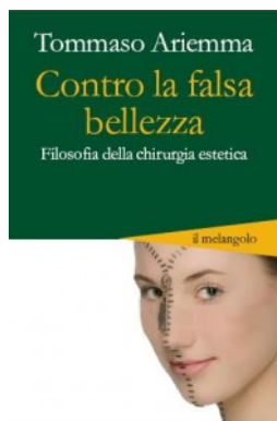
copertina del libro

In proposito, ci può essere utile senz'altro leggere anche "Contro la falsa bellezza" di Tommaso Ariemma (Il Melangolo, Genova), che affronta gli stessi temi, ragionando su quella nebulosa mediatico-pubblicitaria che promuove un'estetica post-umana, e alla fine ci invita a rispondere nella profondità del nostro animo alla domanda: dopo aver alterato una o più parti del nostro corpo, saremo veramente più "liberi di essere noi stessi", come recita la pubblicità?