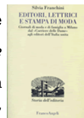
copertina del libro