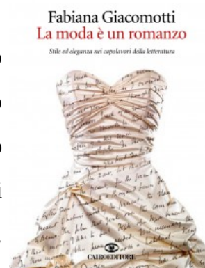
copertina del libro

Passando a tutt'altra latitudine tematica, consigliamo un bel viaggio tra letteratura e stile nei testi letterari degli ultimi tre secoli. Lo percorre per noi Fabiana Giacomotti in "La moda è un romanzo" (Cairo editore), ricostruendo la moda di ogni epoca in base ai ritratti dei personaggi tratteggiati nei grandi romanzi. Ci sfilano davanti, così, la Lucia manzoniana in busto broccato a fiori tipico delle contadine lombarde secentesche, l'Angelica del "Gattopardo" di Tomasi di Lampedusa in abito da ballo rosa pallido, il balzachiano Lucien de Rubempré in gilet dai colori sgargianti nella Parigi delle "Illusioni perdute", la provocante Lolita di Nabokov in bikini a pois, la Holly Golightly di "Colazione da Tiffany" in tubino nero, solo per citarne alcuni. La Giacomotti osserva quanto gli scrittori non solo amino raccontare la storia dei loro eroi, ma indulgano pure a "vestirli" secondo gli stili del rispettivo tempo.