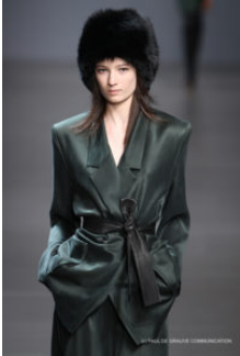
Valentin Yudashkin

Parigi. Sfila al Carrousel du Louvre la collezione A/I 2010/2011 di Yudashkin , primo designer russo della Camera sindacale della Haute Couture francese. Non si poteva scegliere luogo più adatto, dato che alcuni dei suoi più celebri modelli sono stati esposti in passato proprio qui, nelle sale del museo, vere opere d'arte di un grande maestro dell'alta sartoria.